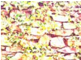
べた塗り 1 Lpsd3-02-1 背景 (白)